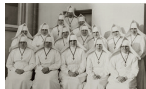
Geistliche Schwestern des Deutschritterordens 1966

Mit mehr als 450 Beschäftigten, 236 Betten, über 15.000 stationär aufgenommenen und 43.000 ambulant behandelten Patienten pro Jahr leistet das Krankenhaus Spittal/Drau im flächenmäßig zweitgrößten Bezirk Österreichs einen unverzichtbaren Beitrag zur öffentlichen Gesundheitsversorgung der Kärntner Bevölkerung und ist ein wichtiger Wirtschaftsfaktor und Jobmotor für die Stadt Spittal/Drau.